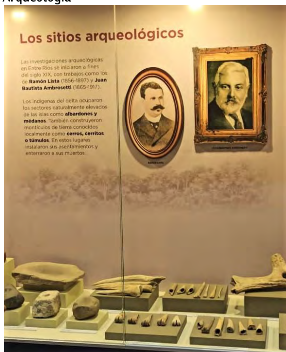
Imagen 1 Filmina de la Sala de Arqueología

La tercera y última es la Sala de Arqueología: en diversos puntos de la provincia de Entre Ríos fueron encontrados múltiples restos materiales arqueológicos de larga data, por ejemplo, puntas de proyectil de tipo cola de pescado que, se asume, fueron utilizadas para las actividades de caza a lo largo del continente americano, hace entre 11 y 10 mil años atrás.