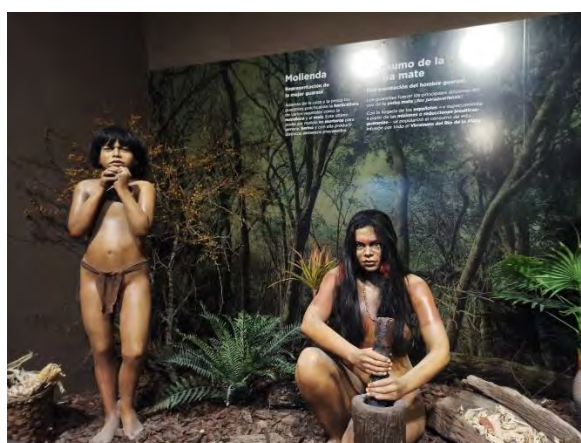
Imagen 3: Exposición del final del recorrido. Una habitación completa destinada a representar a la familia guaraní y sus costumbres.

El recorrido por estas salas concluye con una representación a escala humana de una familia de guaraníes, con vestimenta prehispánica y rasgos arquetípicos y, por último, con una exposición de mapas elaborados por los españoles en el siglo XVII, que muestran su paso en la región.