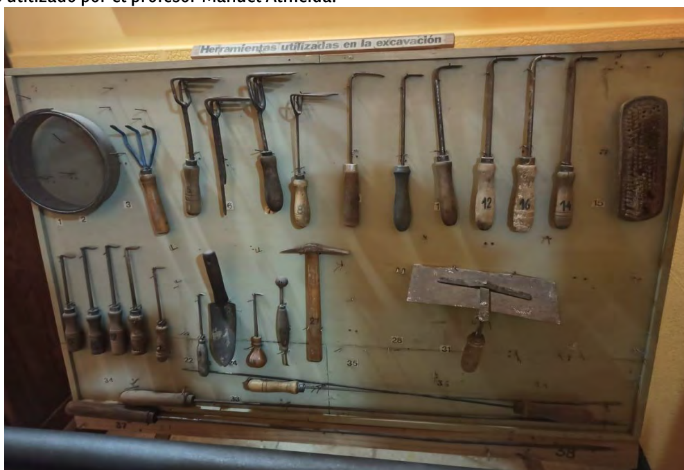
Imagen 6: Foto de filmina expuesta en Salas Especiales. En ellas se encuentra parte del instrumental arqueológico utilizado por el profesor Manuel Almeida.