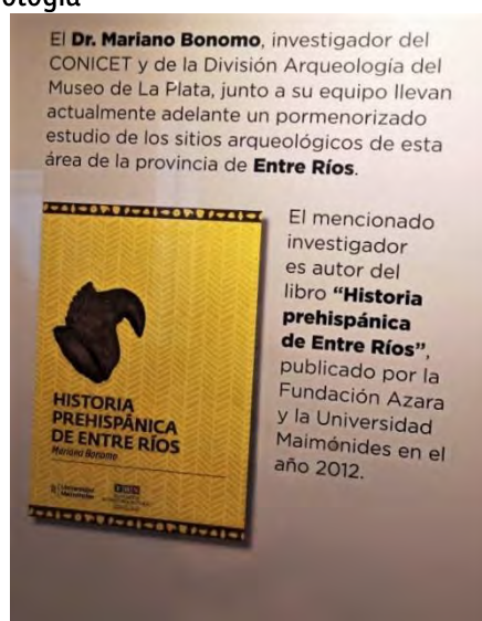
Imagen 2 Filmina de la Sala de Arqueología