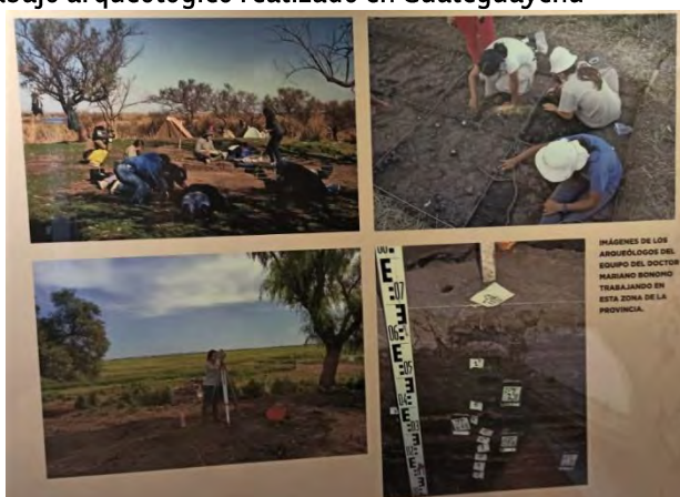
Imagen 5: Filmina sobre el trabajo arqueológico realizado en Gualaguaychú

Además, el museo cuenta con un laboratorio para el trabajo arqueológico, que es utilizado por los científicos que lo frecuentan, previo pedido explícito a los encargados de las gestiones.