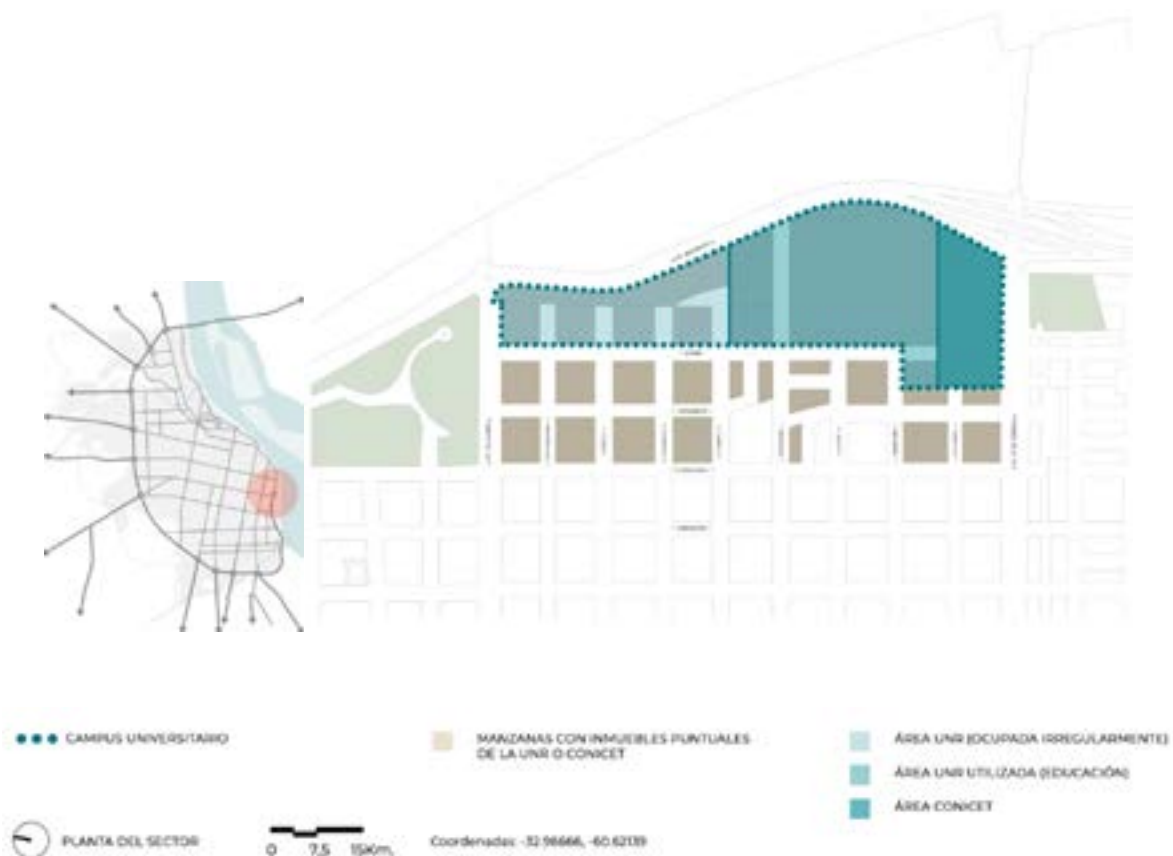
Figuras N° 1a y 1b. Área de estudio y sectores, ubicación relativa.