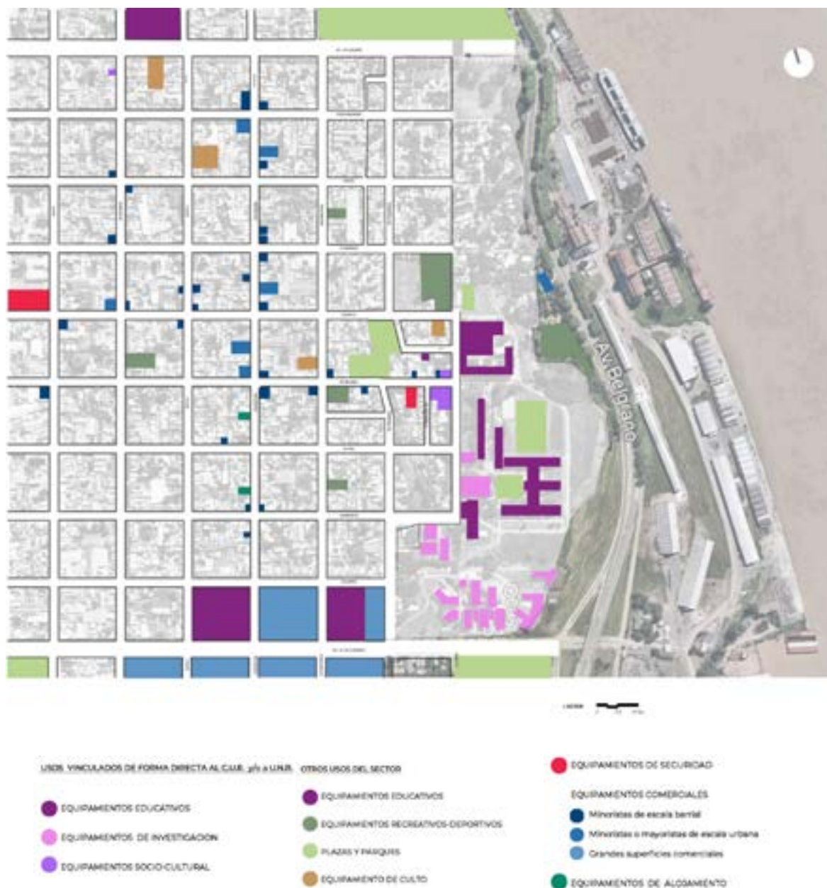
Figura N° 3. Área de estudio ampliada y usos singulares actuales.