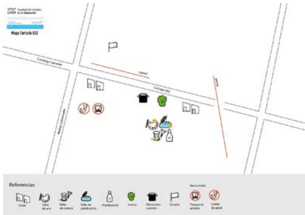
Mapa Cortada 832 – barrio Arroyo Los Berros