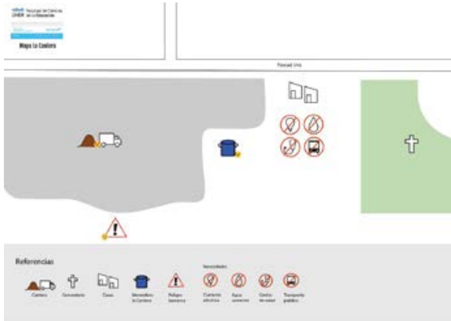
Figura 4 Mapa barrio La Cantera