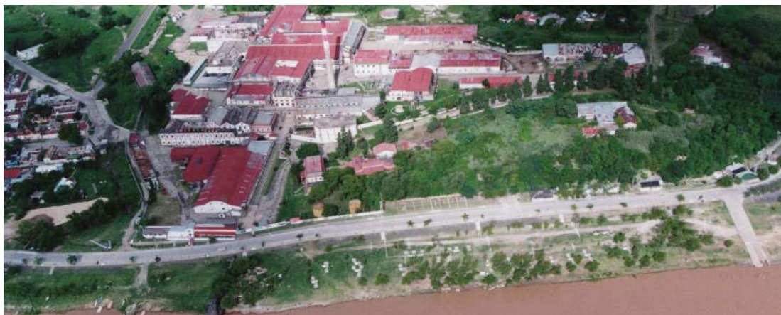
GRÁFICO. Vista aérea del Frigorífico Santa Elena Alim. S.A.

Se percibió, a lo largo de la visita, una excelente higiene , desde corrales, lavadero de camiones, mangas, balanzas y todas las Instalaciones de Planta de faena con acero, paredes en material sin uniones, pisos antideslizantes, frecuencia de piletas, ganchos esterilizados, cámaras con temperaturas muy bajas, con termómetros visibles y permanentes, bateas muy limpias, balizas de avisos, carteles de advertencias, cortinas anti-mosca, azulejados, entre otros. Se complementa con el análisis del agua utilizada a través de todo el recorrido del proceso en Planta.