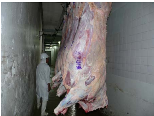
GRÁFICO. Sellos identificatorios

Los subproductos que se obtienen actualmente son: cuero (aprox. el 13,5% del peso del animal; es el que mejor recupero representa), mucanga (se obtiene por barrido de faena, como patas, traquea y se vende aprox. a un valor de $ 4 por animal), tripa (se obtiene aprox. $ 2 por animal) y las achuras (representan un 10% del peso del animal y se obtiene $2,5 por kilo). Con relación a los ingresos y costos, la rentabilidad de este eslabón no resulta satisfactoria (datos significativos como el precio de venta de la media res por parte del Frigorífico –$ 9,90 al momento de nuestra visita–, dan cuenta de esta situación). El gran salto en valores se verifica en el siguiente eslabón de la cadena.