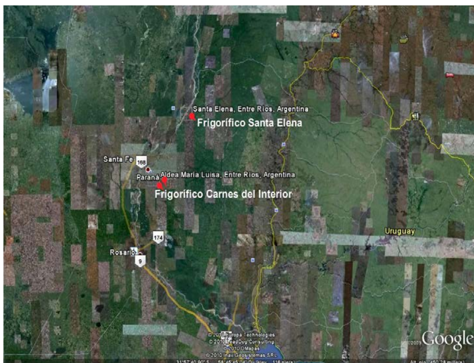
GRÁFICO. Mapa satelital

también la Planta Frigorífica que lleva su nombre; pertenece al Departamento La Paz. El establecimiento Carnes del Interior se encuentra estratégicamente ubicado, a 12 km al sur de la ciudad de Paraná, capital de la Provincia de Entre Ríos, sobre la Ruta 12, unos 8 kms. antes de llegar a la Aldea María Luisa (ver Mapa satelital).